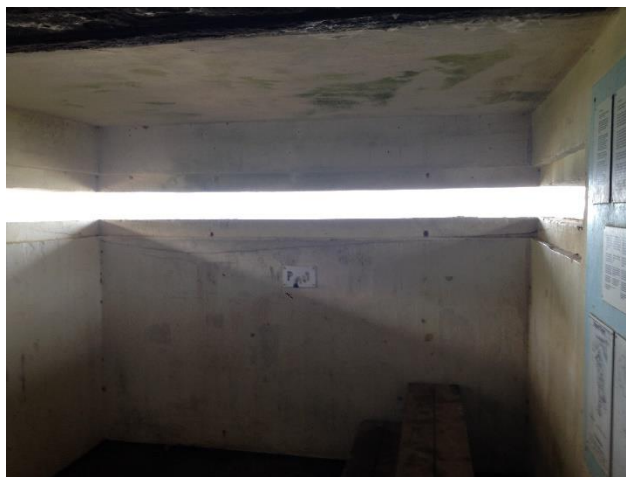
Fra toppen udsigt mod Øst og Svinkløv mm.